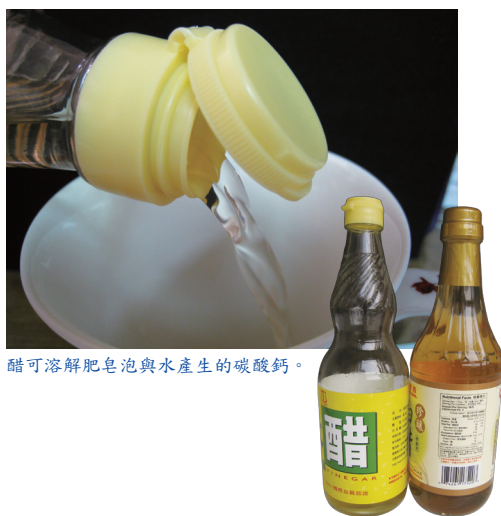
醋可溶解肥皂泡與水產生的碳酸鈣。