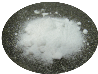
小蘇打粉有很好的摩擦去污效果。