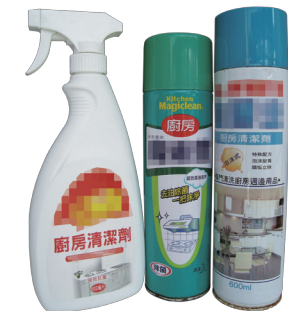
廚房清潔劑的成分經常含有鹼性物質。

◎註：依據環保標章規格，衛浴清潔劑產品pH值不得小於5，廚房清潔劑產品pH值不得大於9。