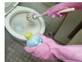
塑膠防水手套保護雙手免於被強酸清潔劑灼傷的危險。