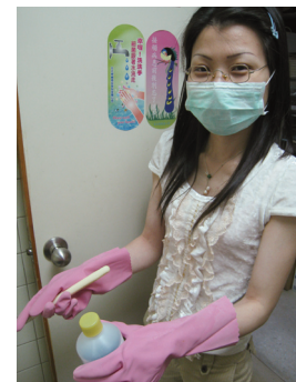
使用強酸強鹼清潔劑時，應戴口罩、塑膠防水手套保護自己。

強酸或強鹼這類清潔劑遇到水時，經常產生白煙，如鹽酸或硫酸遇水會產生嗆人的氣體，吸入會造成呼吸道輕微燒傷；若皮膚直接接觸強酸或強鹼，也有灼傷的危險，因此使用時務必讓空間通風，帶上塑膠防水手套，並避免腳部接觸沖洗後的污水。