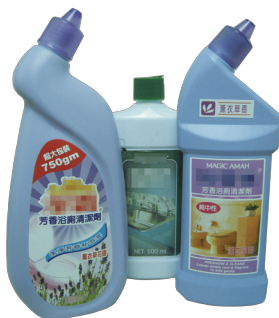
浴室清潔劑經常添加酸性物質。